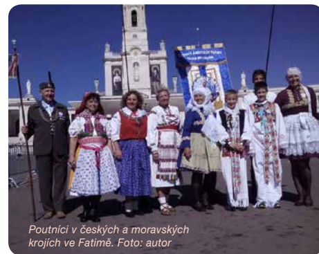
Poutníci v českých a moravských krojích ve Fatimě.