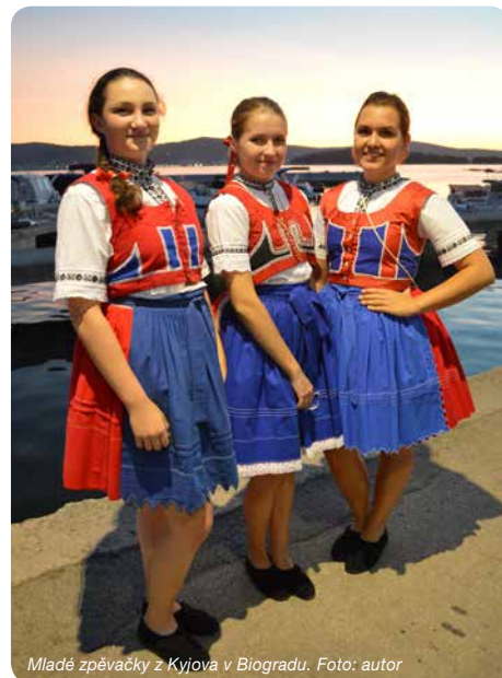
Mladé zpěvačky z Kyjova v Biogradu.

„Myslím, že vystoupení mělo velký ohlas. Mnozí lidé se s námi zastavovali a chválili nás. Nebyli to jen místní a turisté z České republiky a ze Slovenska, ale například i z Německa nebo Francie,“ popsal at-