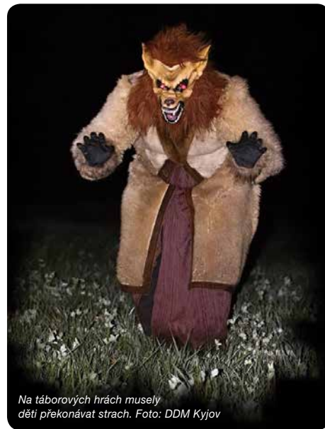
Na táborových hrách musely děti překonávat strach.

Domeček se účastnil také několika akcí ve městě. Především Kyjovského sportovního koktejlu, kde prezentoval své kroužky, a několik svěřenců Domečku si připravilo vystoupení. Další velmi zajímavou akcí, na jejíž realizaci se Domeček podílel, byla výstava papírových modelů o Pohár kyjovské radnice. Akce se kaž-