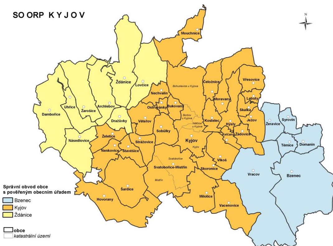
Obrázek č. 1: Mapa SO ORP Kyjov

Kyjovsko zahrnuje sedm mikroregionů: Babí Lom, Bzenecko, Hovoransko, Moštěnka, Nový Dvůr, Podchřibí, Ždánicko.