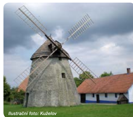
Ilustrační foto: Kuželov