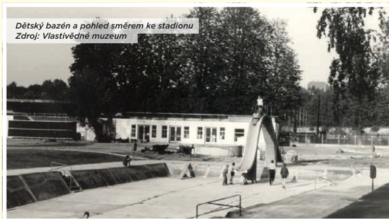
Dětský bazén a pohled směrem ke stadionu