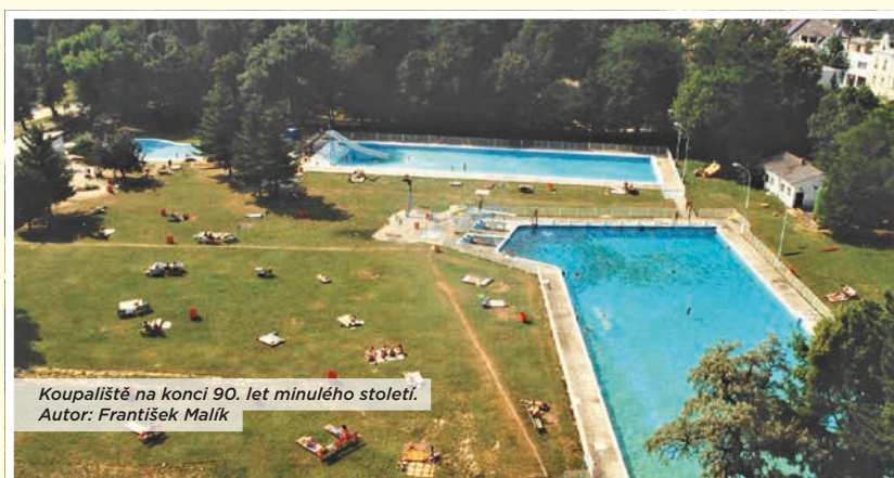
Koupaliště na konci 90. let minulého století.