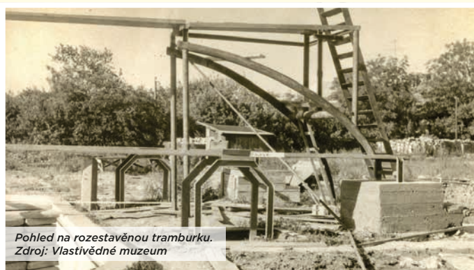
Pohled na rozestavěnou tramburku.