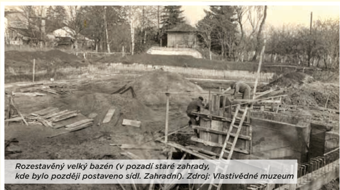
Rozestavěný velký bazén (v pozadí staré zahrady, kde bylo později postaveno sídl. Zahradní).