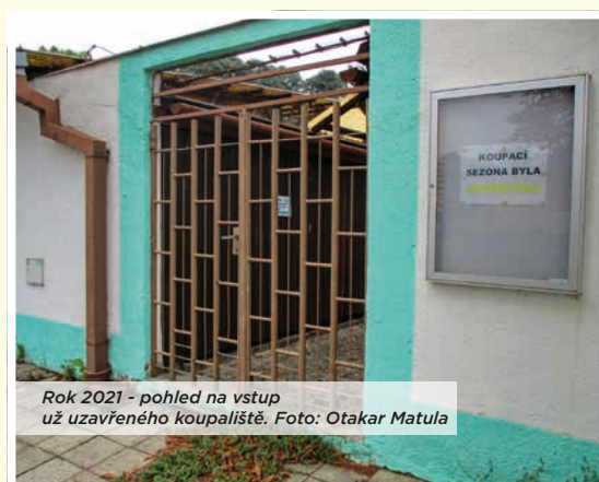
Rok 2021 - pohled na vstup už uzavřeného koupaliště.