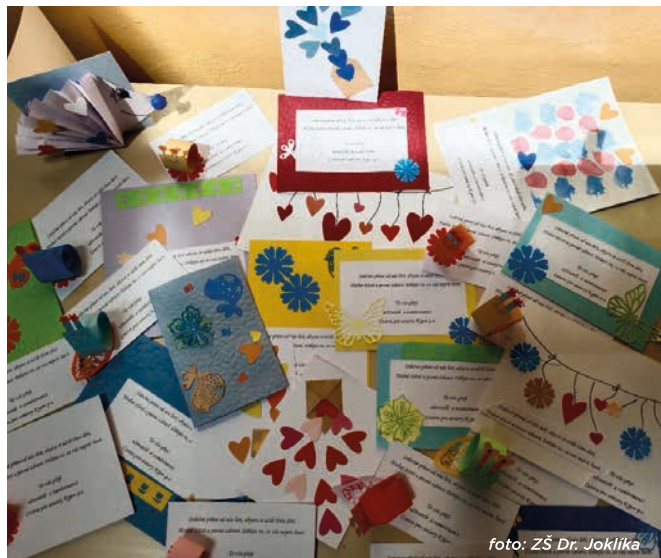
foto: ZŠ Dr. Joklíka