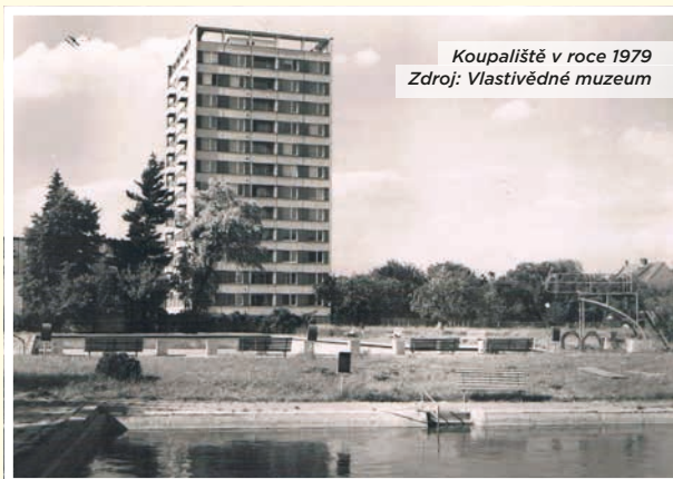
Koupaliště v roce 1979