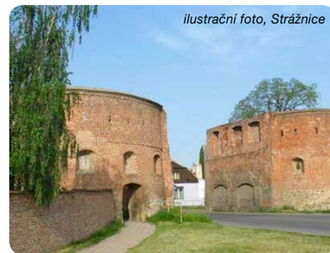
ilustrační foto, Strážnice

Uzávěrka redakčních příspěvků do příštího čísla je 23. června 2017