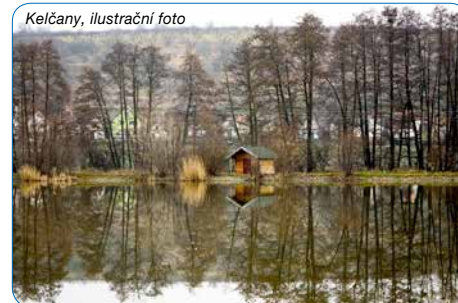
Kelčany, ilustrační foto