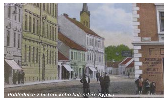
Pohlednice z historického kalendáře Kyjova

Kalendář se dá jako každoročně sehnat na informačním centru. Jako dárek pro hosty ho bude letos používat nejen radnice, ale také místní šroubárna, takže kalendář se dostane do různých míst České republiky.