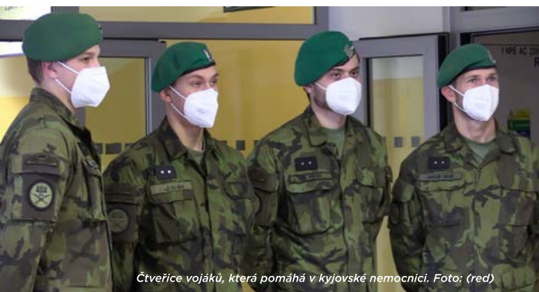
Čtveřice vojáků, která pomáhá v kyjovské nemocnici.