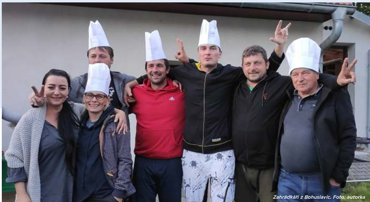
Zahrádkáři z Bohuslavic.