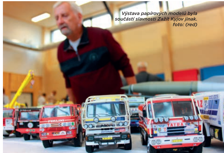
Výstava papírových modelů byla součástí slavnosti Zažít Kyjov jinak.

A součástí této slavnosti byl letos také šestý ročník Poháru kyjovské radnice, tedy soutěžní výstava papírových modelů, kterou připravuje dům dětí a mládeže. Na pět stovek aut, kostelů, letadel nebo dětských pokojíčků přišli obdivovat fandové